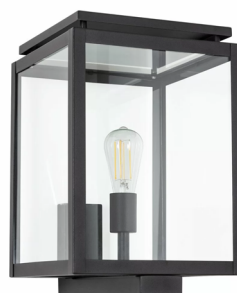
Wandarmatuur begane grond ( nabij voor deur volgens verkooptekening )